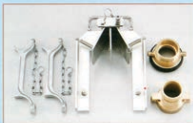
別売：消防ネジキット